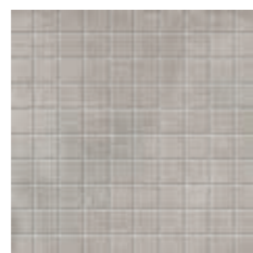
•Mosaico 30x30 - 12"x12" (tessere 2,8x2,8 - 1 1/6 "x1 1/6 "