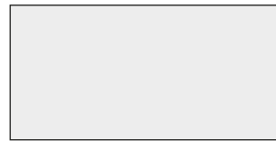
30x60 (12"x24") Nat Rt